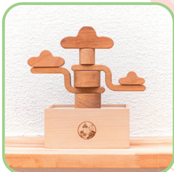
現在配られている誕生祝い品 「Kodomo Bonsai」

「木育」。このことばは、2004年に北海道で生まれました。そしてその2年後、国が定める「森林・林業基本計画」の中にも盛り込まれました。「食育」ほどは広まっていないものの、いまや「木育」も全国いたるところで取り組まれるようになりました。その先駆者である東京おもちゃ美術館では、これまで主に「ウッドスタート宣言」「木育キャラバンの開催」「姉妹おもちゃ美術館の設立」の3つを柱に木育推進に取り組んでいます。