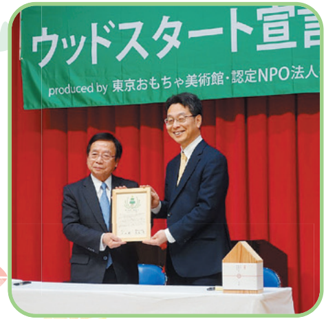
ウッドスタート宣言調印式

六ヶ所村は、2019年3月、青森県で初めて「ウッドスタート宣言」を行いました。そして村内1歳児全員に、青森県産材を活用したオリジナルの木製玩具を贈っています。「木育キャラバン」もすでに2回開催しています。村内ばかりか、むつ市、三沢市などからも多くの親子が遊びに来て、木のおもちゃの魅力を存分に味わっていかれました。