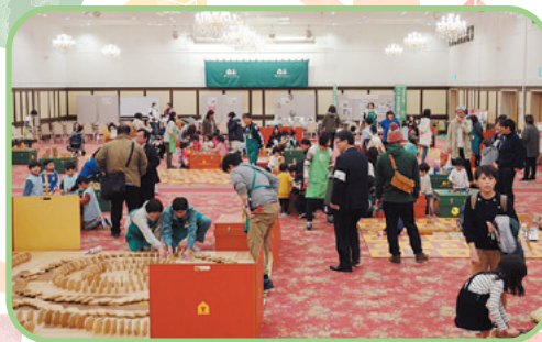
2019年に行われた「第1回もくもく！ 木育キャラバンinろっかしょ」

現段階で実現できていないのは、3つめの「姉妹おもちゃ美術館の設立」です。いや、実はすでに「おもちゃ美術館」に匹敵するくらいの木育空間があります。2021年に開設された「泊こども園」にある木育広場「ろっくもっくぶらざ」です。