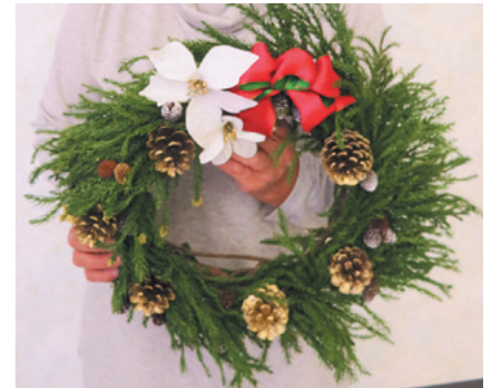
クリスマスバージョン