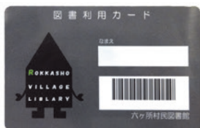
新しい「図書利用カード」は 図書館キャラクターのデザイン

「図書利用カード」の有効期限は5年となっています。期限切れの方は、新しいカードを作成しますので、運転免許証・マイナンバーカードなど住所の確認できるものをご持参ください。