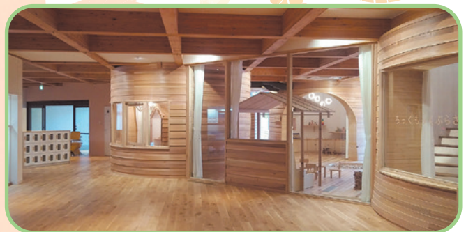
泊こども園内にある木育施設「ろっくもっくぶらざ」

六ヶ所村は、今でこそ、林業が生業として盛んなわけではありませんが、かつて森林鉄道が走っていて、青森ヒバの伐採が盛んでした。その歴史に思いを馳せながら、木の持つ力を活用して、子どもの豊かな心を育て、様々な人々をつなぎ、持続可能な社会、さらにはインクルーシブな社会を実現する。そんな「おもちゃ美術館」（青森県初！東北2館目！）をぜひ設立してもらいたい、そう強く願っています。