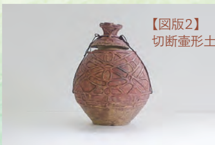
【図版2】 切断壺形土器 大石平遺跡