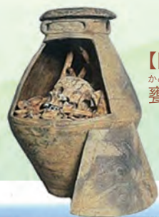
【図版1】 陶器棺 弥栄平(1)遺跡

このほかにも、村内では縄文後期前半の遺跡から、手形・足形付土版、動物形土製品、鐸形土製品など祭祀や儀礼に関連するような様々な遺物が数多く出土していることから、六ヶ所村は縄文時代の精神世界を解明する上で重要な地域といえるでしょう。