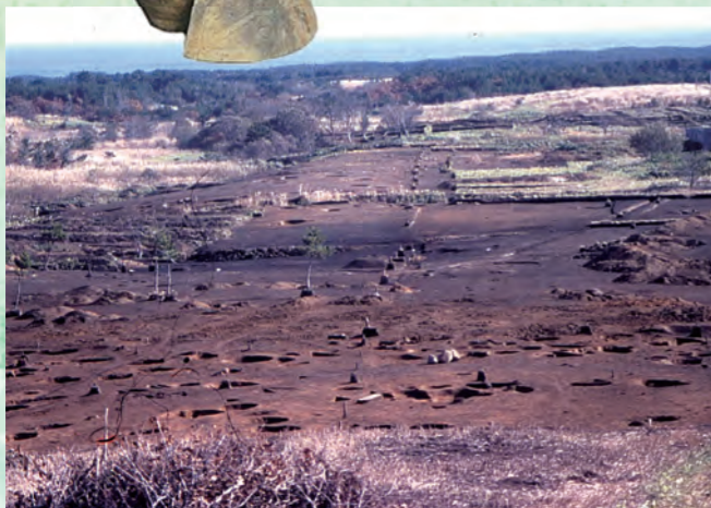
【図版3】 大石平遺跡の発掘風景