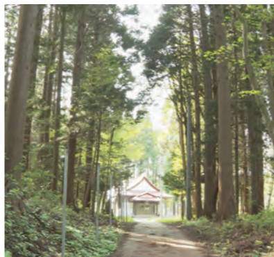
スギ林の中鎮座する熊野神社

六ヶ所村各地に点在する「神社」に焦点を当てて、建立の歴史や地元で根付いた祭事などを紹介する番組を制作します。神社は日本の伝統と信仰の象徴であり、そこには神々の存在が感じられる神秘的な雰囲気が漂っています。歴史的な建造物や美しい景色、それぞれの神社が持つ独自の魅力を、映像を通して皆様にお届けいたします。