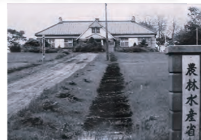
女性の縄文人骨が出土した 原々種農場

今から約60年前に弥栄平遺跡(現量子科学センターの南側)で縄文時代後期(約4,000年前)の成人女性の人骨入りの甕棺土器が、ジャガイモ畑から見つかりました。縄文時代のお墓は一般的に土葬ですが、これは再葬土器棺墓と呼ばれ、まず被葬者は石棺へ仮埋葬されます。その後、白骨化した骨は洗われて、頭骨など大きな骨から小さな骨へと丁寧に甕棺土器に納められたと考えられています。彼女は社会的に地位の高い女性だったのでしょうか。企画展『縄文美子がいた4,000年前の世界』が開催中です。ぜひ、見に来てください。