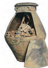
かめかん 甕棺土器 弥栄平(1)遺跡